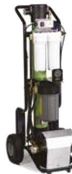
MODULO ADDOLCITORE HIGHPURE - HPE