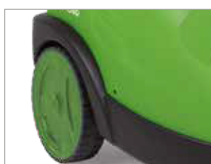
RUOTE DI GRANDE DIAMETRO PER UNA FACILE MOVIMENTAZIONE