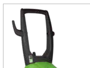
MANIGLIONE ERGONOMICO INTEGRATO, POSALANCIA E SUPPORTO TUBO PER AVERE TUTTO A PORTATA DI MANO